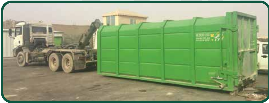
أثناء الرفع WHILE LIFTING