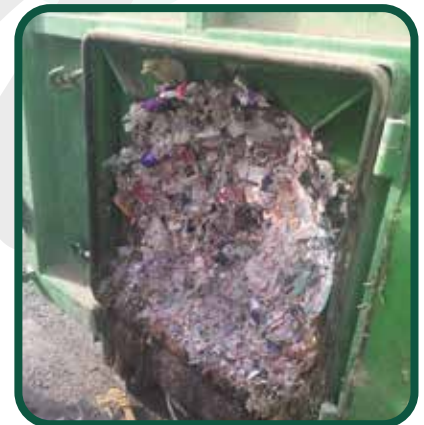
النفايات المضغوطة COMPACTED WASTE