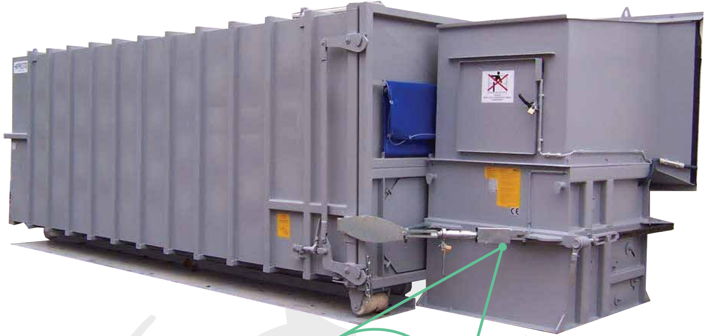
شكل اللولب FLIGHT SHAPE

ت.م. شركة اتحاد الخدمات العالمية United Global Services Co.